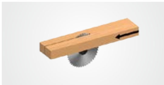
A = 870 мм, B = 2165 мм, C = 1905 мм