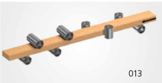
A = 5350 мм, B = 2165 мм, C = 1905 мм

Строгание и раскрой по длине за один проход. Узел продольной распиловки увеличивает производительность.