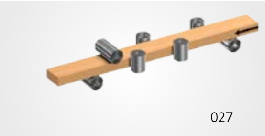
A = 5060 мм, B = 2165 мм, C = 1905 мм

Разумное дополнение для изготовления сложных профилей за один проход. Гибкое применение для обработки всех четырех сторон.