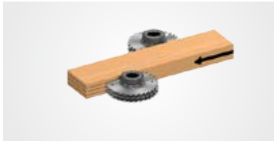
A = 1000 мм, B = 2165 мм, C = 1905 мм