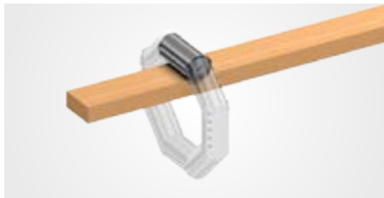
A = 850 мм, B = 2165 мм, C = 1905 мм